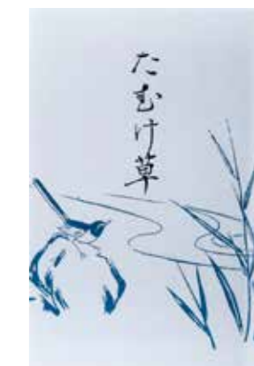
祖父の俳句の小冊子「たむけ草」